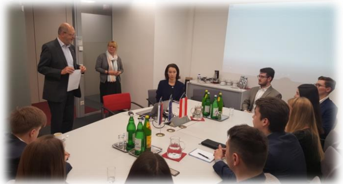
Презентация австрийских компаний, ведущих свой бизнес на территории Российской Федерации