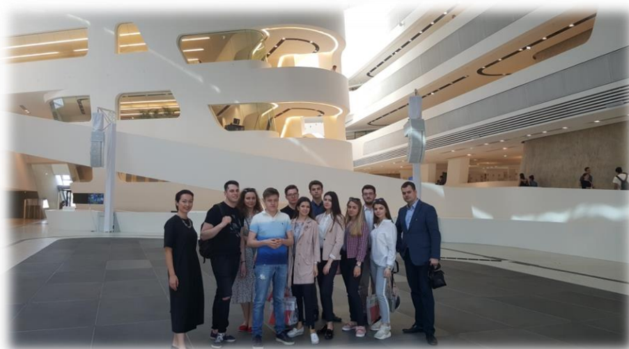
В главном здании Экономического Университета Вены (WU)