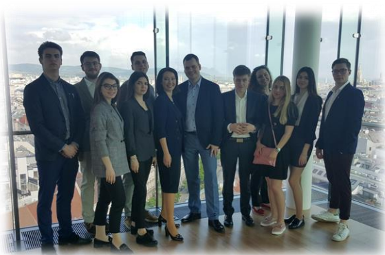
В бизнес-зале «Sky Lounge» на террасе WKO